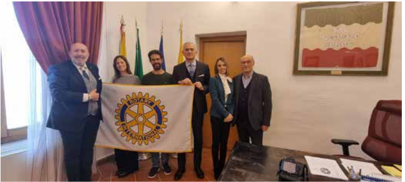
Mazara del Vallo