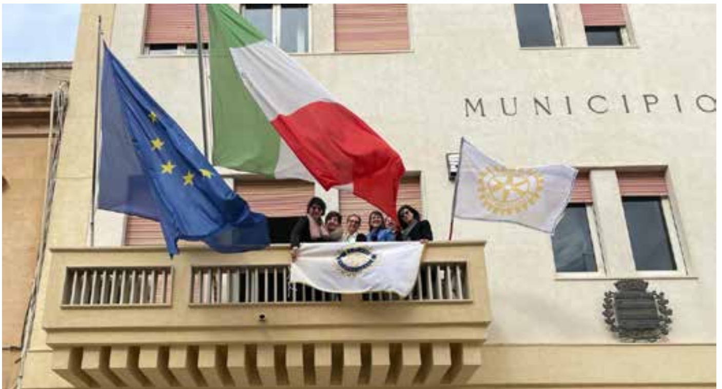
Trapani Birgi Mozia