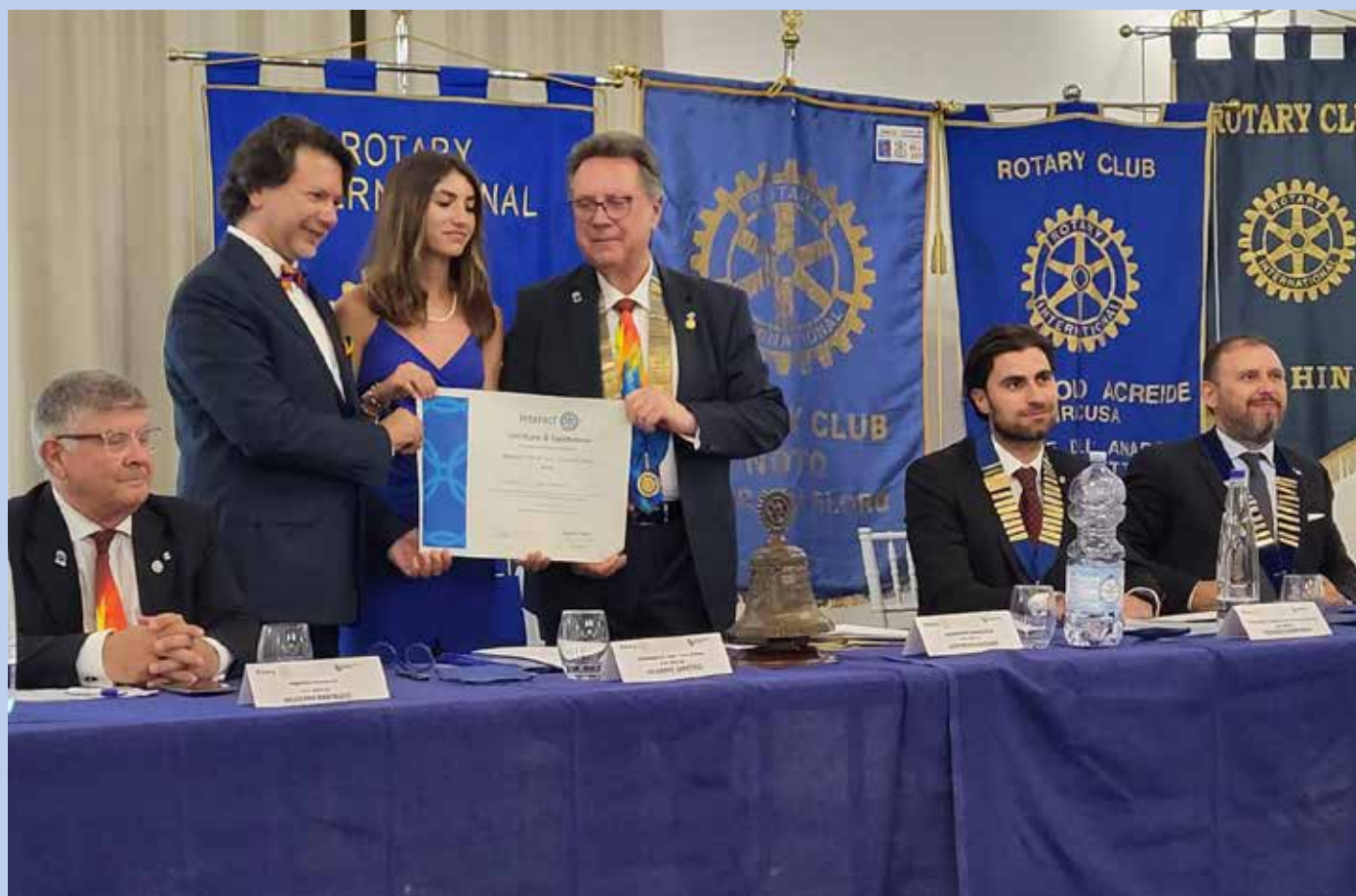
Il governatore Goffredo Vaccaro consegna il Certificato di costituzione per l'Interact di Noto