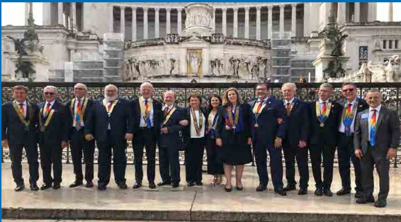
I governatori dei Distretti Rotary d'Italia davanti all'Altare della Patria