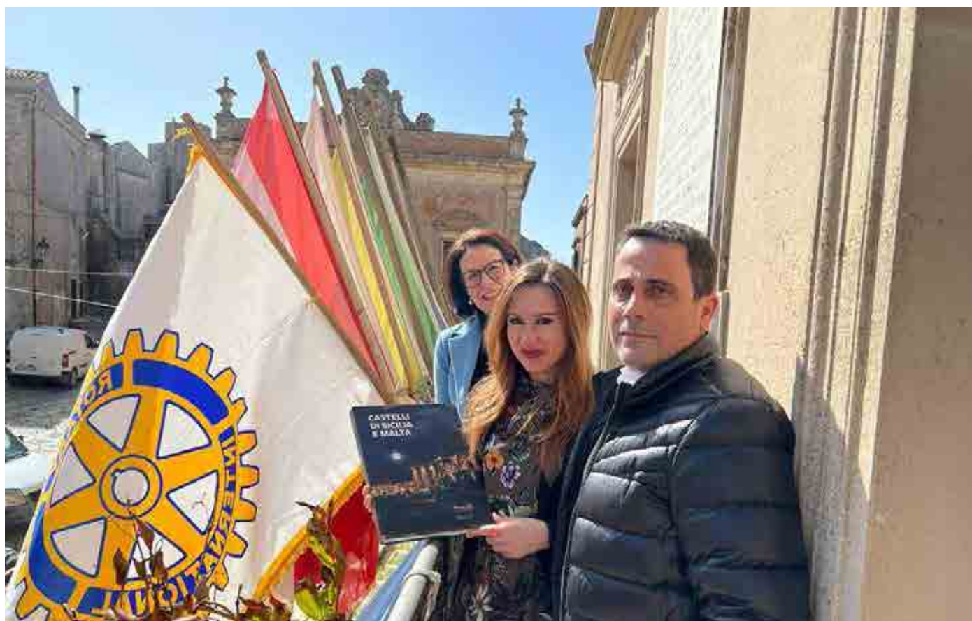
Trapani - Erice