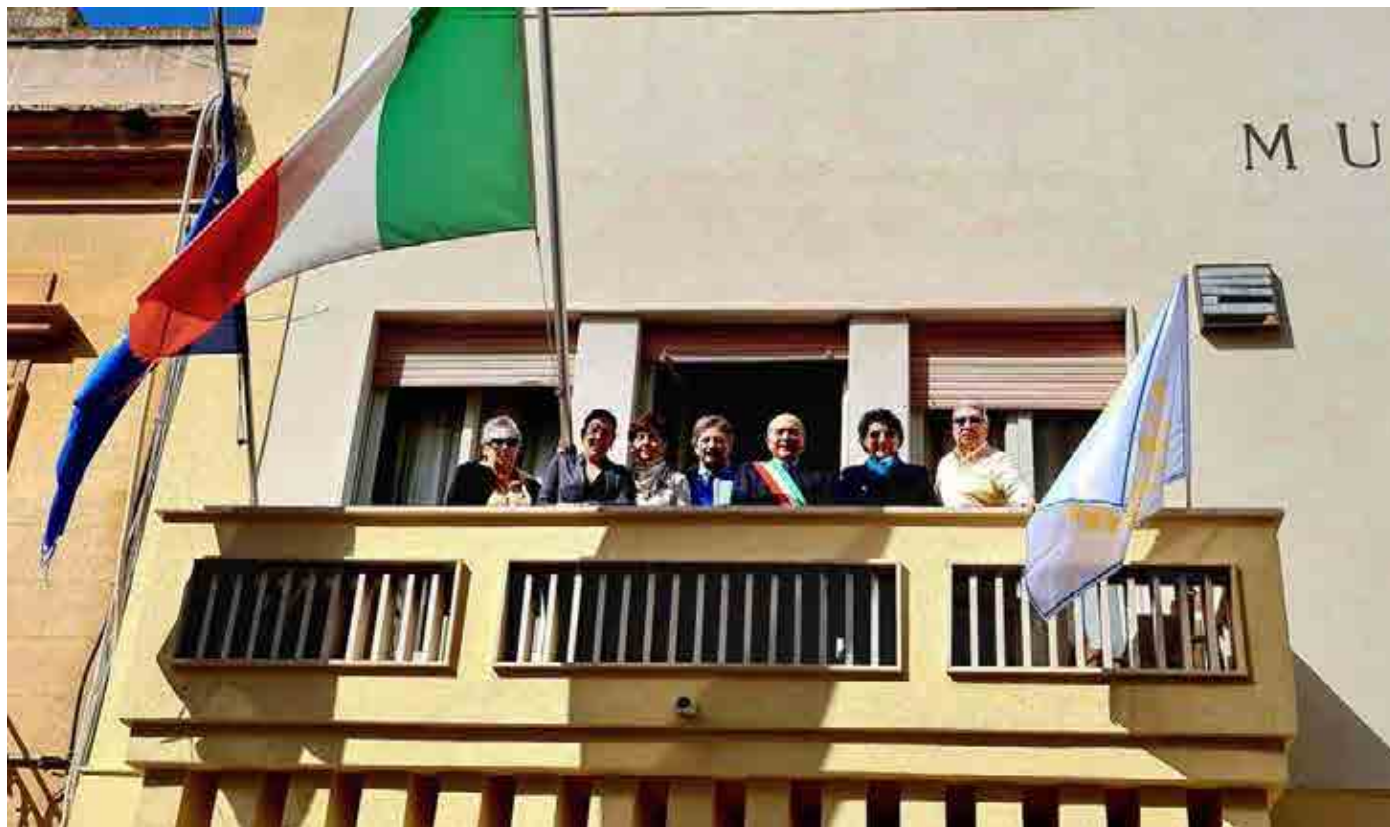
Trapani - Birgi Mozia