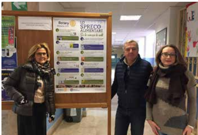
Mazara del Vallo