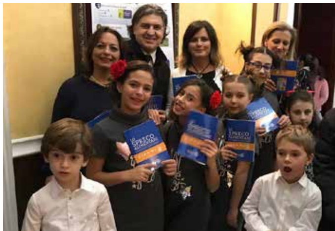
Mazara del Vallo