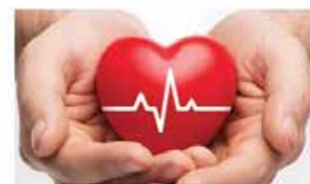
"Questioni di cuore"